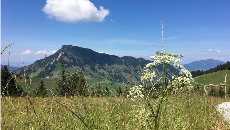
Acherli - Stanserhorn - © Roland Baumgartner (Nidwalden Tourismus), Region Luzern-Vierwaldstättersee