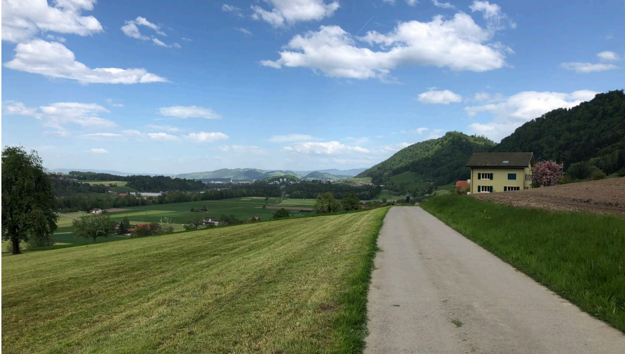
Velotour Emme-Reuss