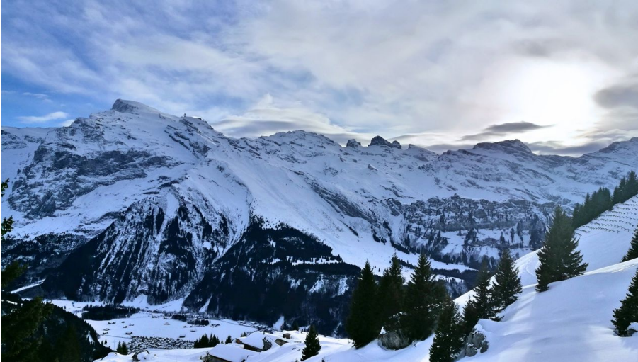
Engelberg - Titlis Tourismus, Engelberg-Titlis Tourismus