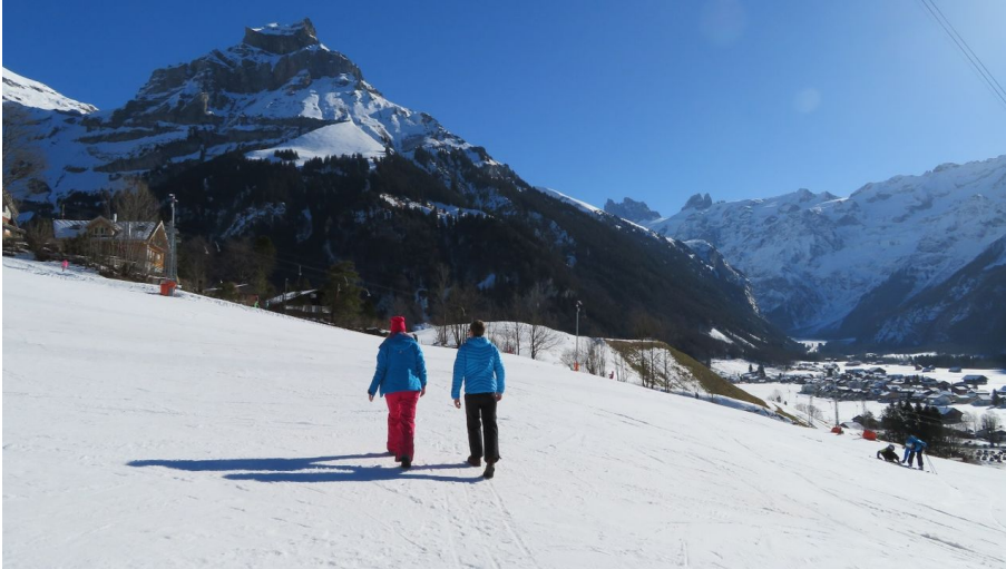
Engelberg - Titlis Tourismus, Engelberg-Titlis Tourismus