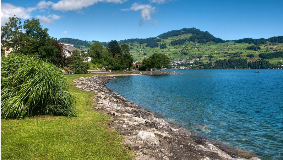
Badewiese Neuseeland