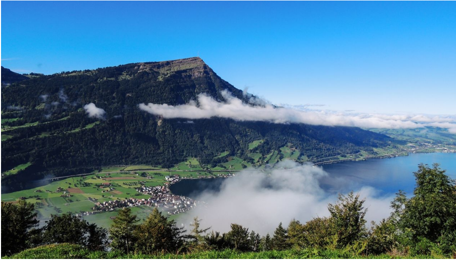
Blick auf die Rigi