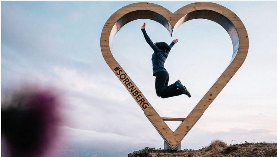
Herzrahmen auf dem Fototrail Rothorn auf dem Briener Rothorn in Sörenberg