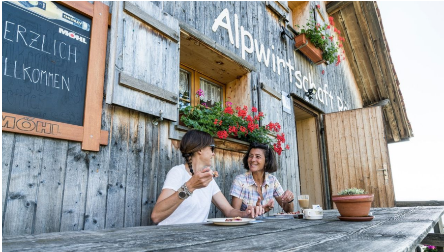
Alpwirtschaft Rüb