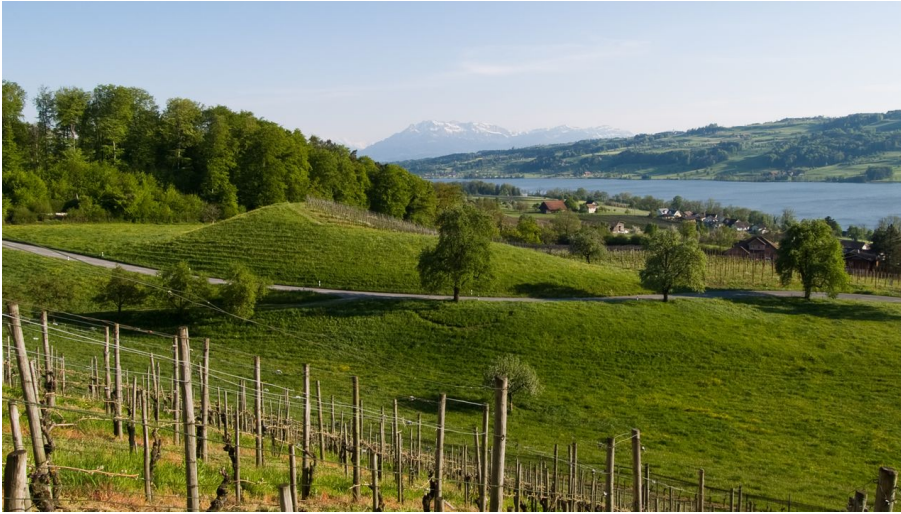
Seetal: Wandertipp Nr.14 Ballwil - Schloss Heidegg - Gelfingen