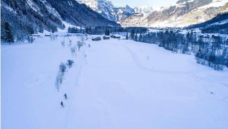
Engelberg - Titlis Tourismus, Engelberg-Titlis Tourismus