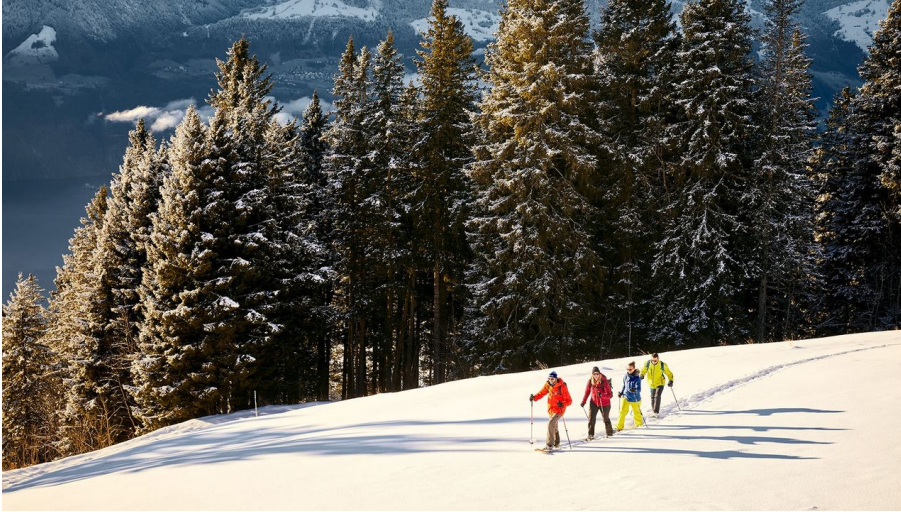
Eine Schneeschuhtour auf der Rigi mit Blick auf See und Berge