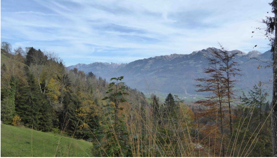
Blick Richtung Giswil vom Grossteilerberg