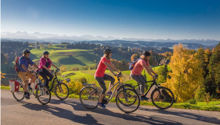
Unterwegs auf der Herzroute #99 im Emmental auf der Etappe Willisau - Burgdorf. - © Christof Sonderegger, Erlebnismacher AG - #wirsindofflinehelden