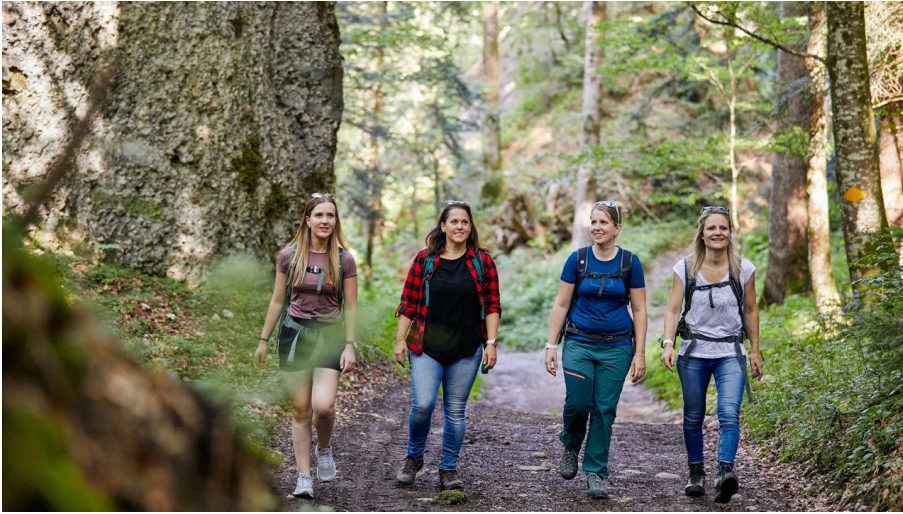
Lauschige Wälder spenden Schatten an heissen Sommertagen.