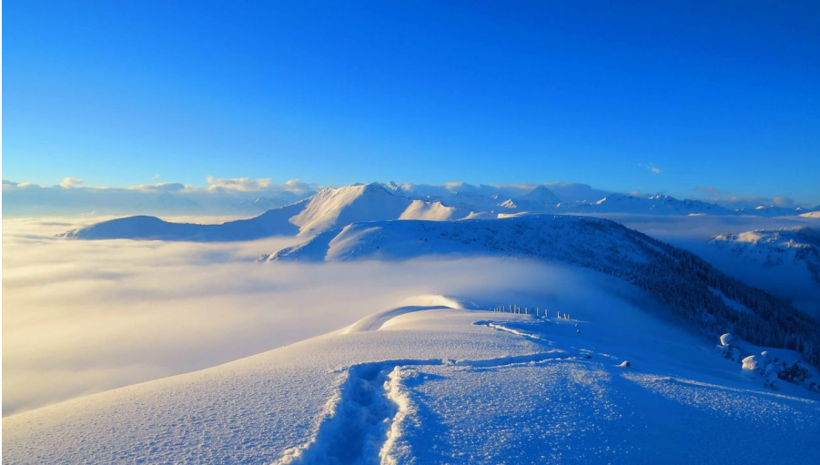
Schneeschuhtouren Langis