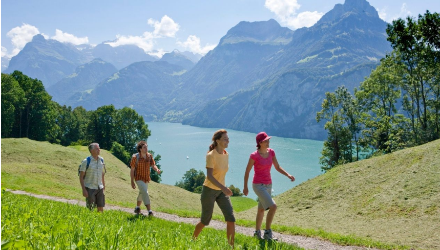
Aussichtreicher Streckenabschnitt des «Weges der Schweiz» - © André Burri, Region Luzern-Vierwaldstättersee