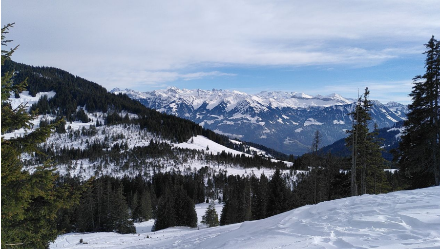
Langis Trail