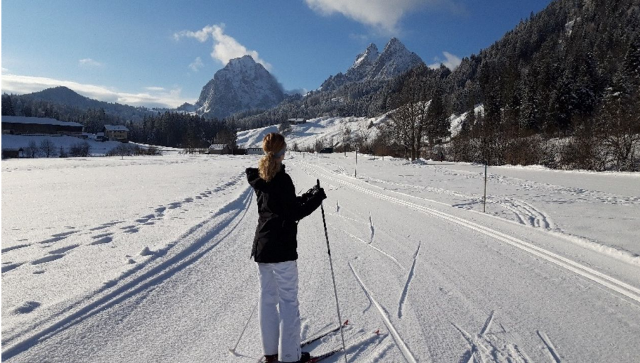
Langlaufen mit Blick auf die Mythen