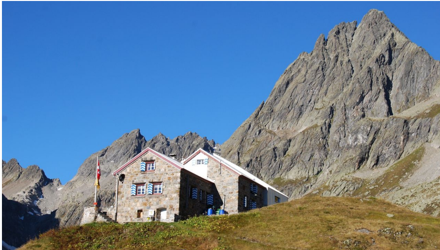
Leutschachhütte SAC