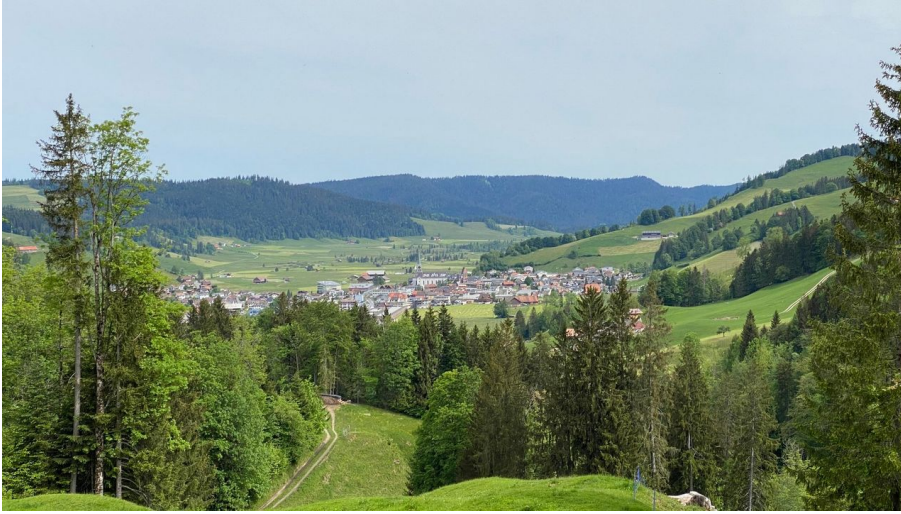
Blick auf Rothenthurm.