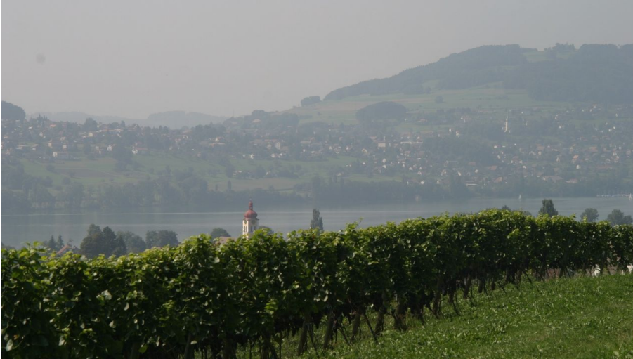
Seetal: Wandertipp Nr.10 Meisterschwanden - Bettwil - Aesch LU - © Seetal Tourismus, Seetal Tourismus