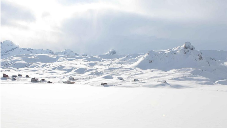
Obwalden Tourismus, Obwalden Tourismus