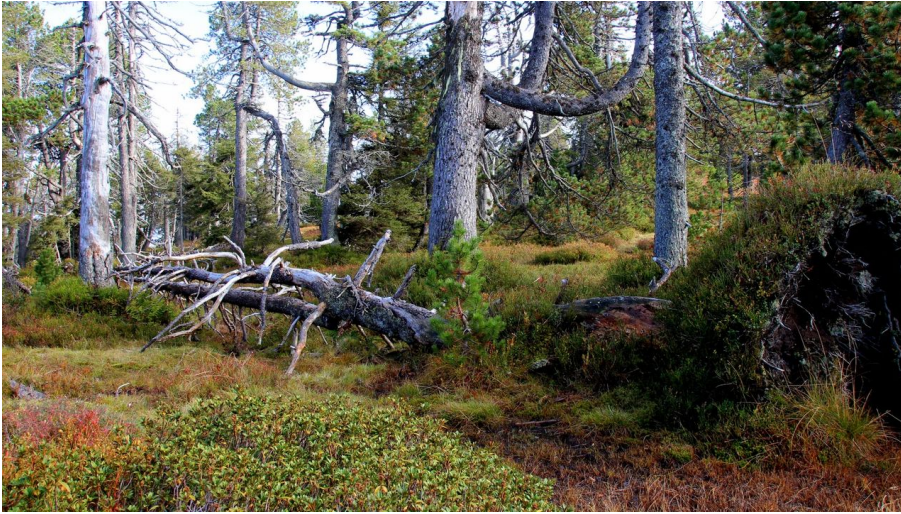
Urtümlich und Wild ist es auf dem Abschnitt auf die Haglere - © Richard Portmann, UNESCO Biosphäre Entlebuch