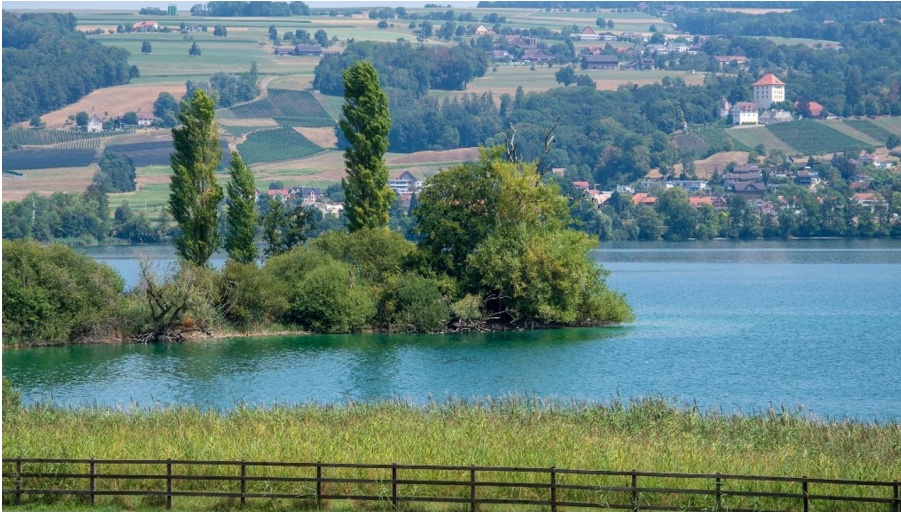
Herlisberg mit Blick auf den Baldeggersee