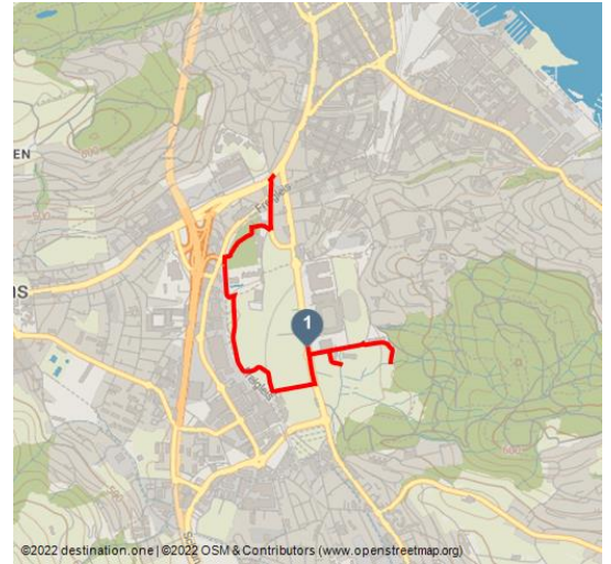
©2022 destination.one | ©2022 OSM & Contributors (www.openstreetmap.org)