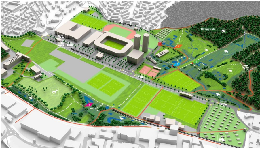
Plan Allmend - © Laura Birrer, Region Luzern-Vierwaldstättersee