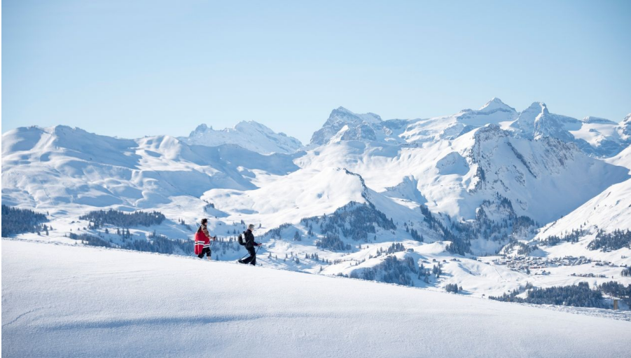
Schwyz Tourismus, Einsiedeln-Ybrig-Zürichsee