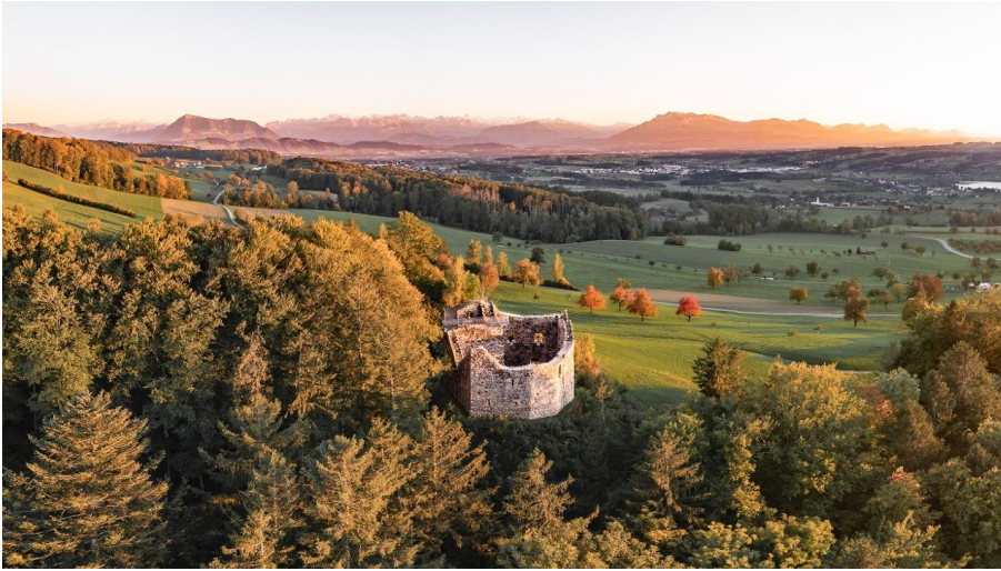
Burgruine Nünegg im Herbst