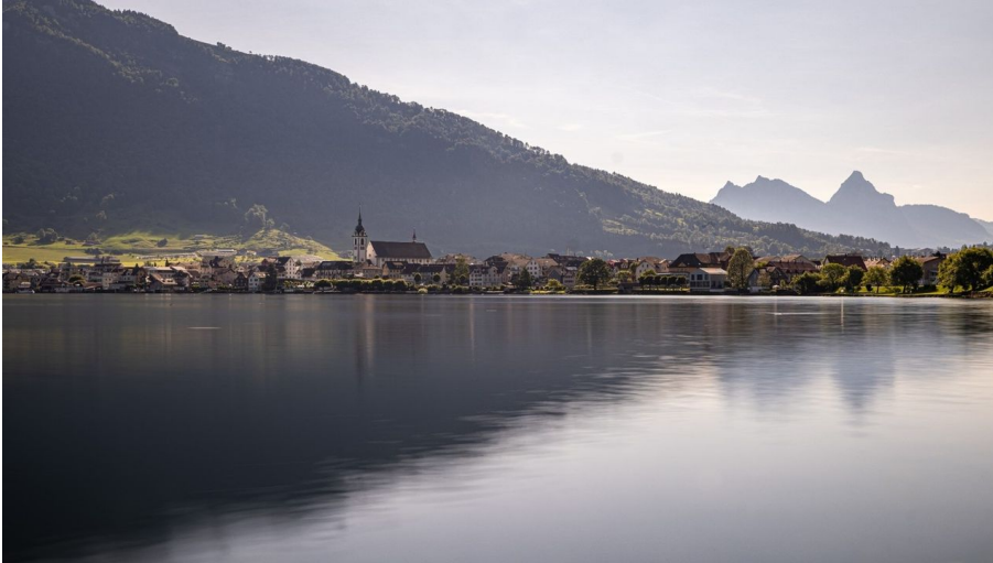
Nach der aussichtsreichen Wanderung genießt man eine Brise am Zugersee