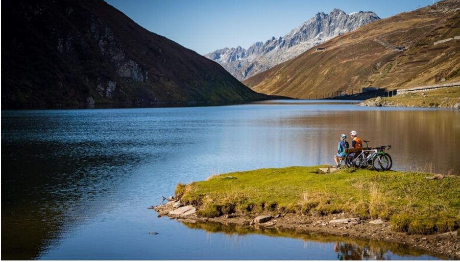
Andermatt-Urserental Tourismus GmbH, Ferienregion Andermatt