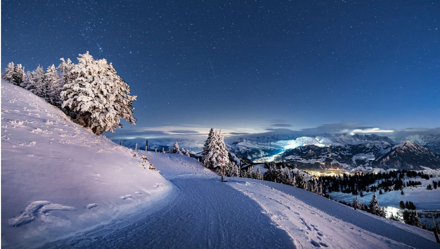
Die Rigi bei Nacht