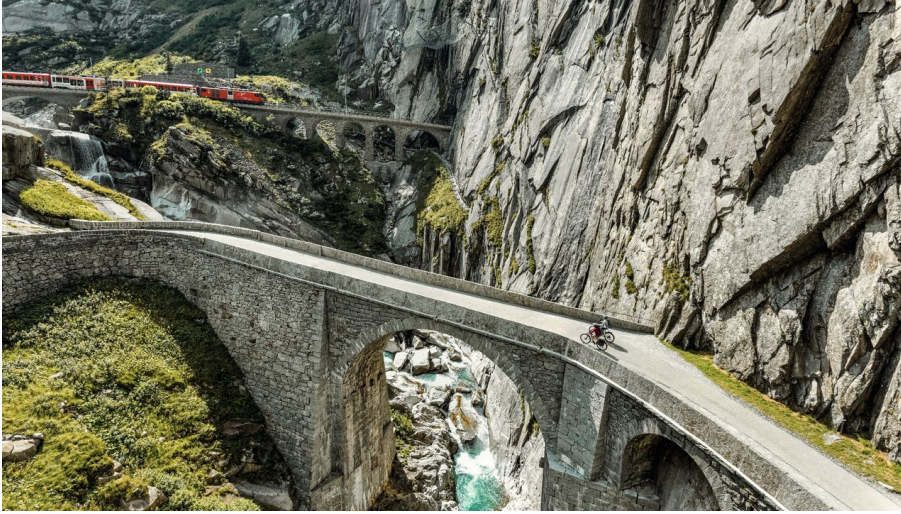
Mit dem E-Bike auf der Route 1291 über die Teufelsbrücke bei Andermatt.