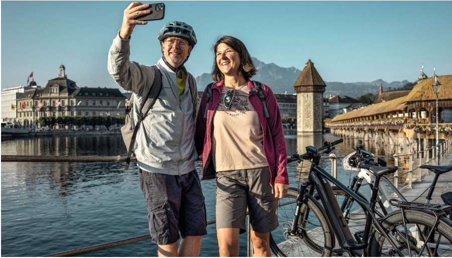
Ein Selfie mit dem Wasserturm in Luzern vor dem Start der Route 1291.