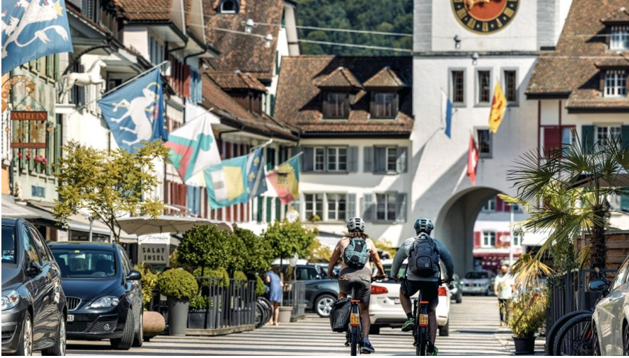
Die Fahrt durch das historische Städtchen Willisau gilt als Highlight der Route 1291.