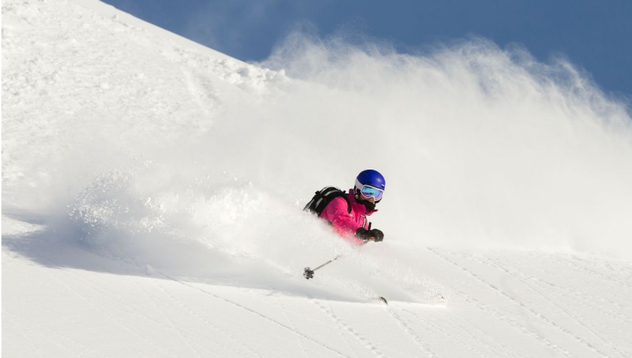
Engelberg - Titlis Tourismus, Engelberg-Titlis Tourismus