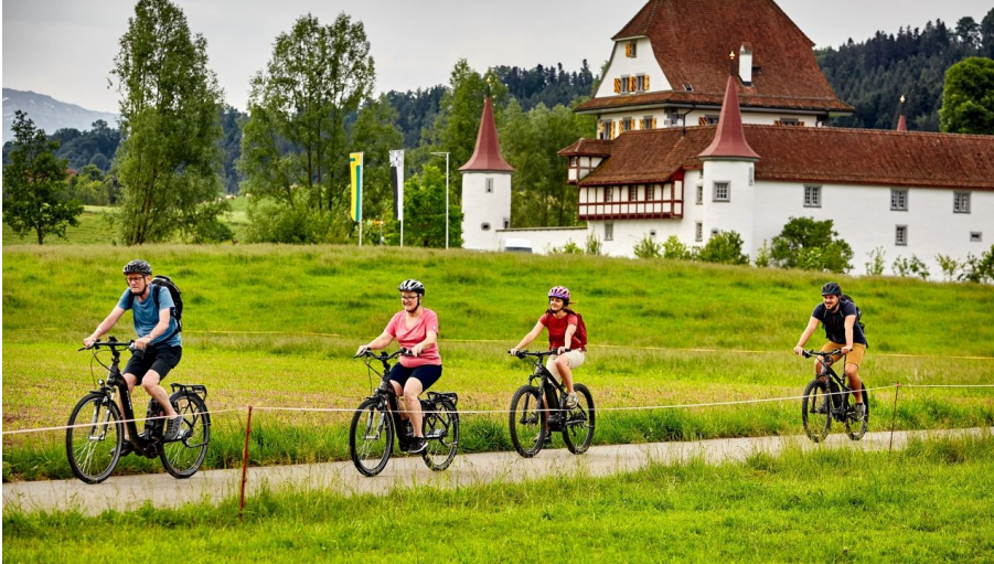
Wasserschloss Wyher