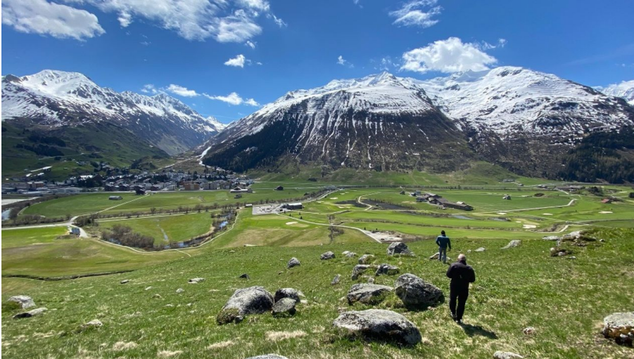
Rundwanderung Bätzberg