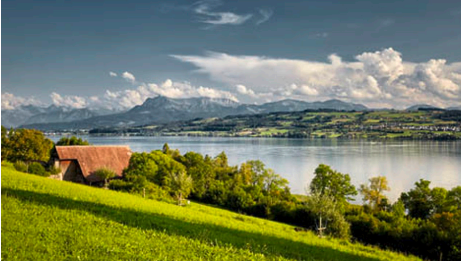
Ausblick Sempachersee