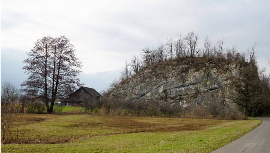
Aussichtspunkt Schornen