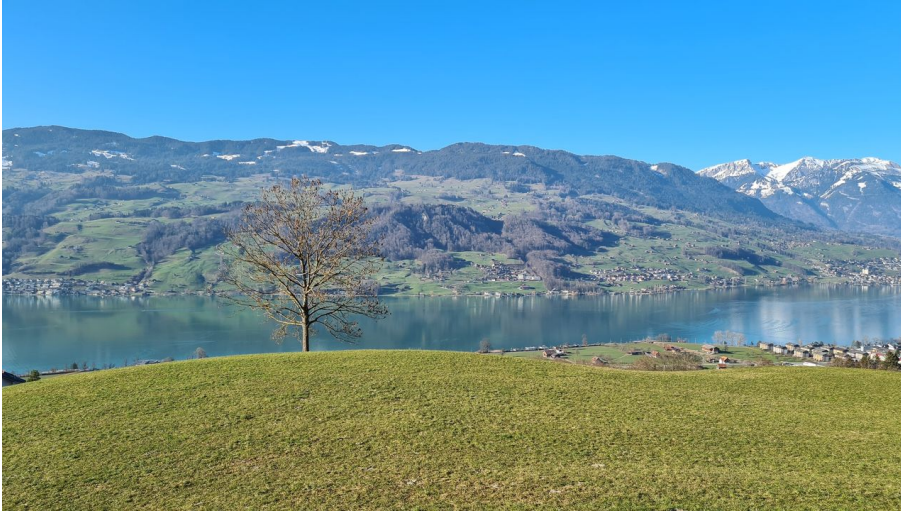
Sachsler Höhenweg