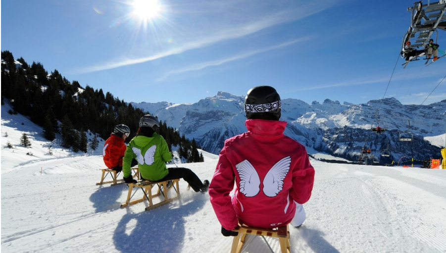
Engelberg - Titlis Tourismus, Engelberg-Titlis Tourismus