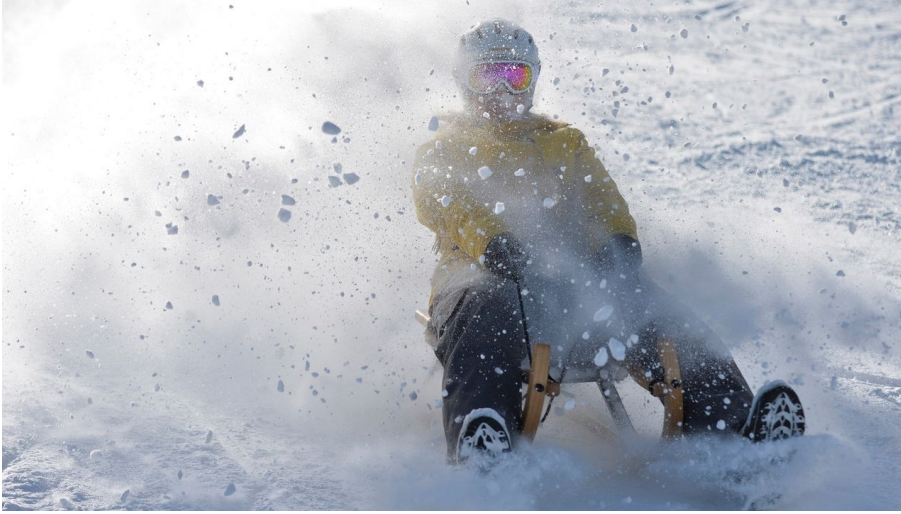
Eine rasante Abfahrt ist garantiert