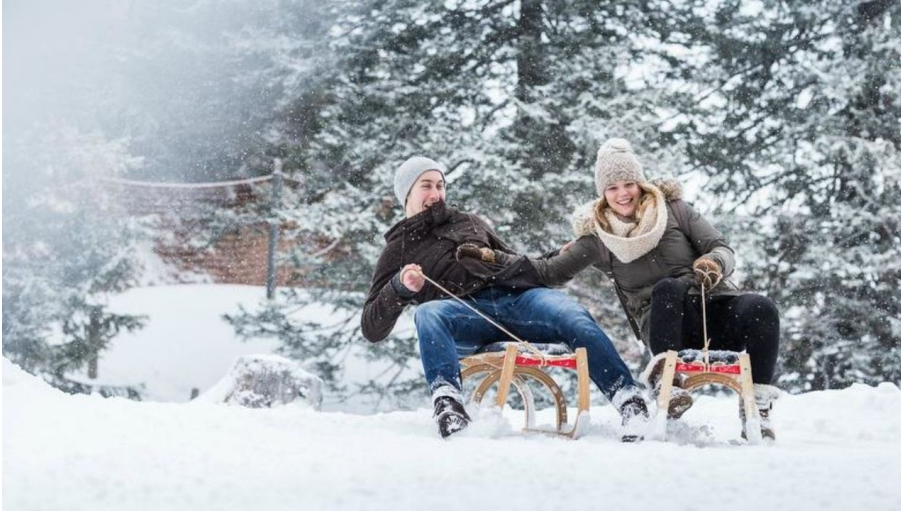
Gäste-Service Rigi, Gäste-Service Rigi