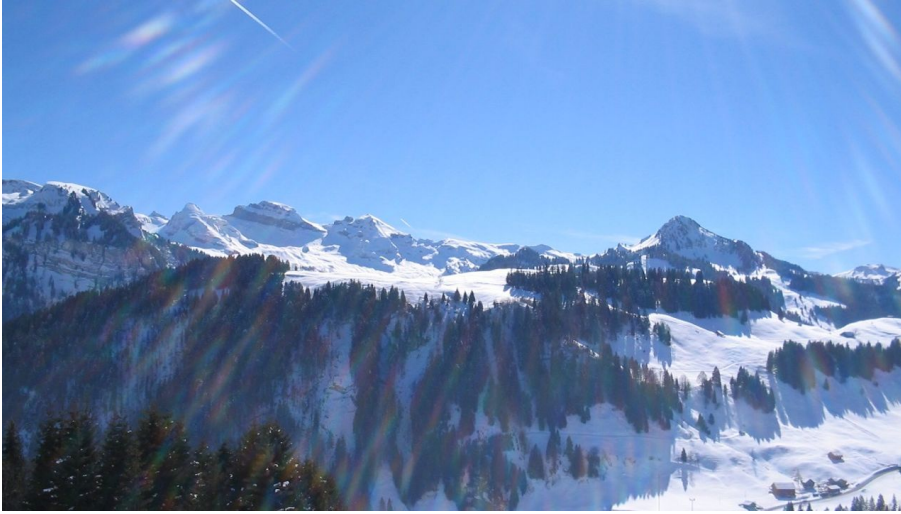
Aussicht ab Höchgütsch, Roggenstock sowie Twäriberg, Druesberg, Forstberg