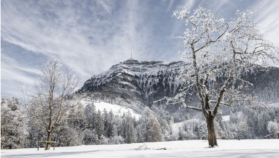
Seebodenalp im Winterkleid