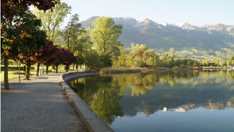
Seepromenade Sarnen