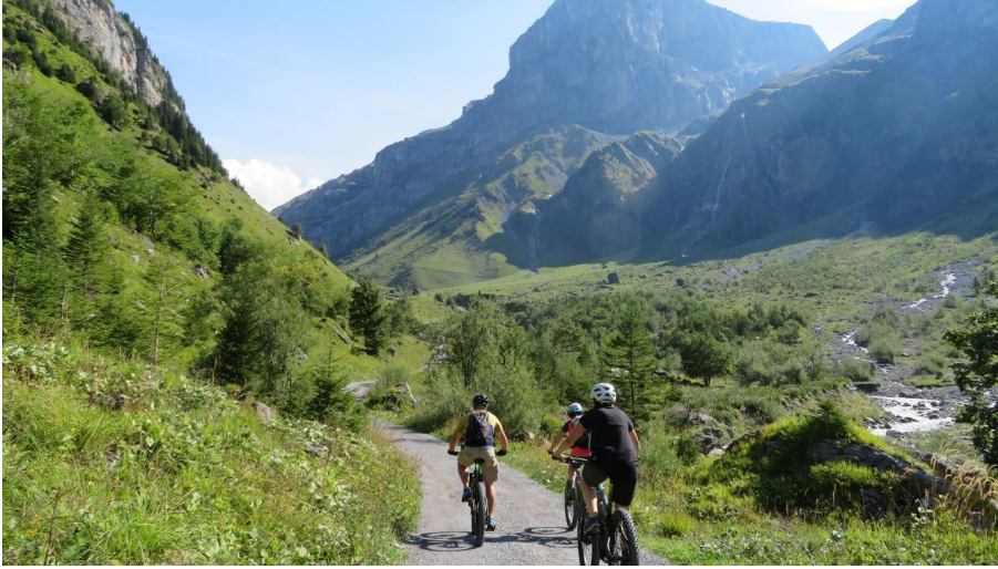
Engelberg - Titlis Tourismus, Engelberg-Titlis Tourismus