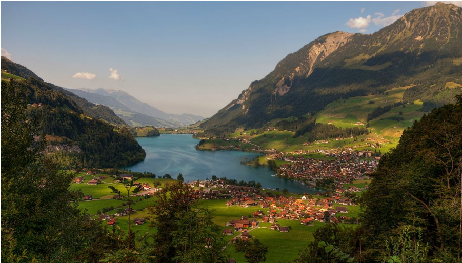
Blick vom Brünigpass auf den Lungernersee