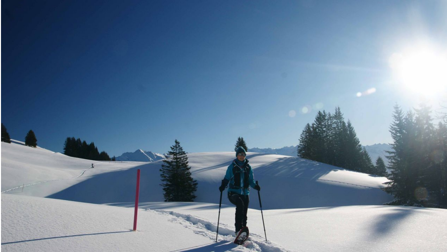
Obwalden Tourismus, Obwalden Tourismus