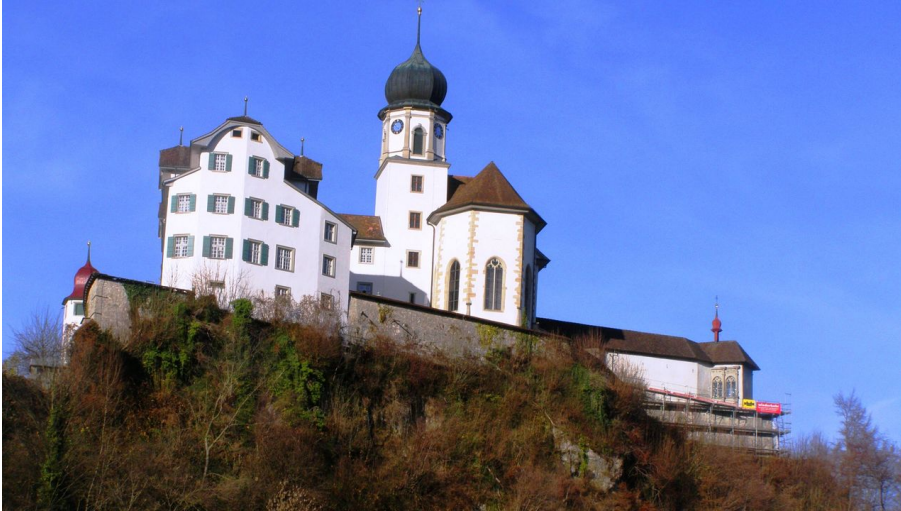
Kloster Werthenstein