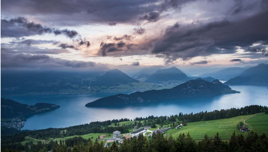
Blick auf Rigi Kaltbad, Bürgenstock, Stanser-, Bouchserhorn und Vierwaldstättersee